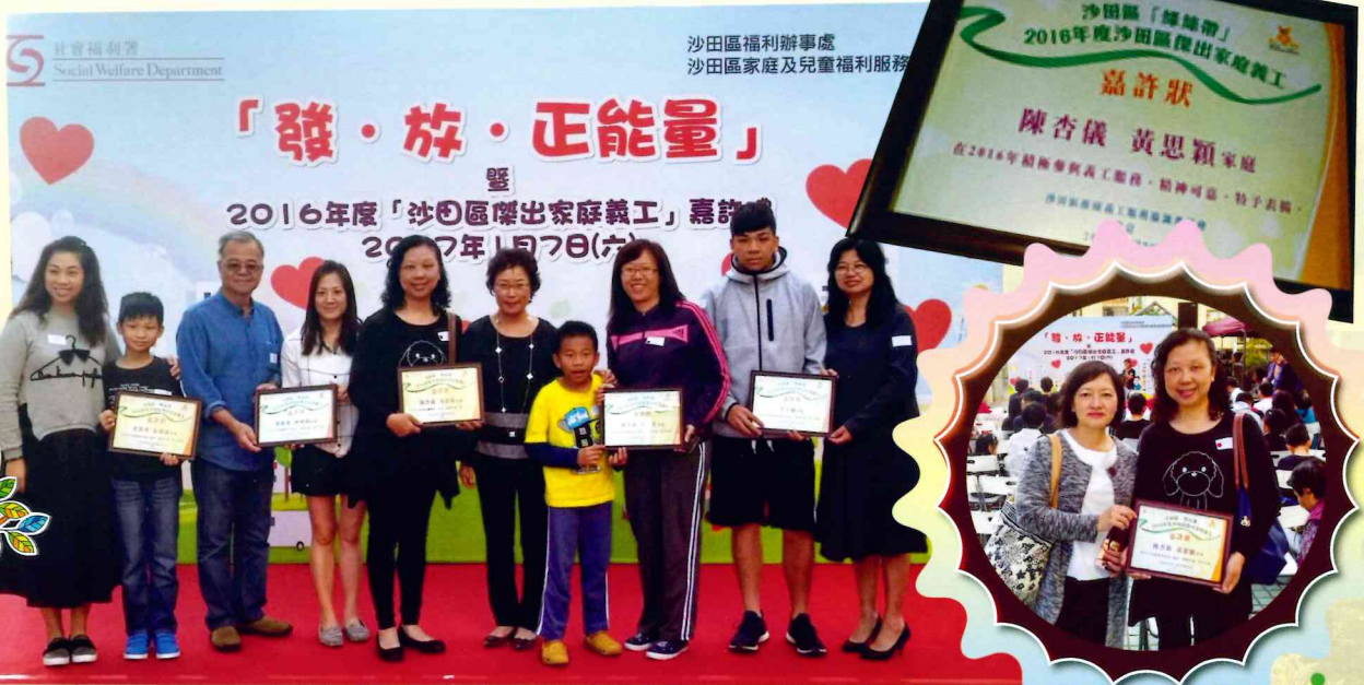
陳女士與其他得獎者和頒獎嘉賓合照