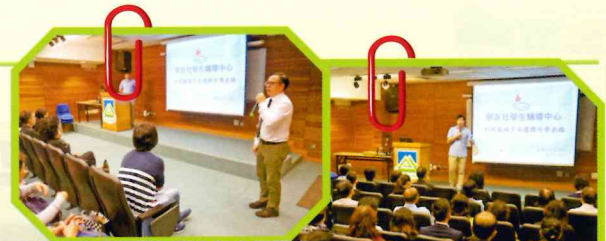
升學及就業輔導組鄭主任介紹講者

本會於二零一六年十一月十八日（星期五）下午七時三十分至八時三十分，邀請學友社主講「本地非聯招升學途徑」講座。內容主要為協同學友及家長掌握更多本地非聯招升學途徑（學位及文憑課程）資訊，令家長了解如何協助子女選擇適合的升學出路、並掌握最新的升學資訊。當晚有60多位家長出席晚會，大部份家長反應熱烈、並期望家教會日後能開辦更多相關的講座。