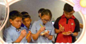
「我們快寫下自己的名字在月餅盒上！」同學期待著自己的成果

農曆八月十五日為一年一度的「中秋節」，而中秋賞月吃月餅這習俗，由來已久。月餅最早出現在唐朝。一開始，它只是人們祭月時的一種供品。由於月餅的味香甜，形狀極似圓的月亮，於是人們將它看成團聚的象徵。