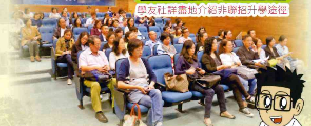
家長專注聆聽子女升學或就業的最新發展