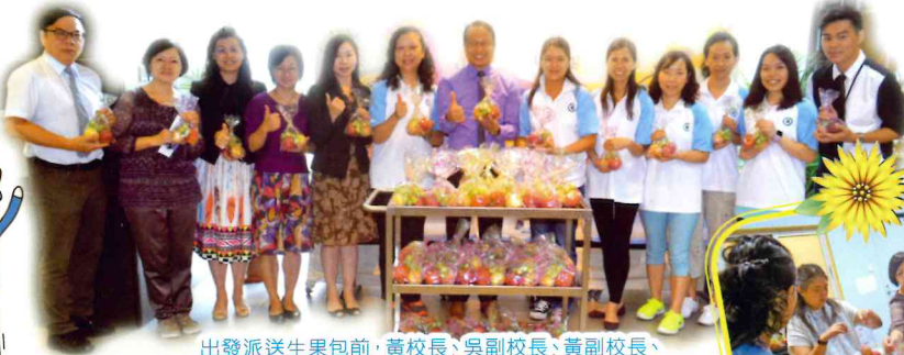
出發派送生果包前，黃校長、吳副校長、黃副校長、李助理校長、老師及家長義工先拍張大合照