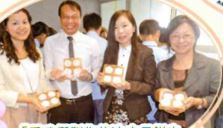
「看我們製作的冰皮月餅也不錯啊！」校長、副校長和助理校長展示他們的成果