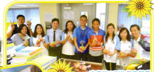
家長義工到教員室親手致送生果包給各老師