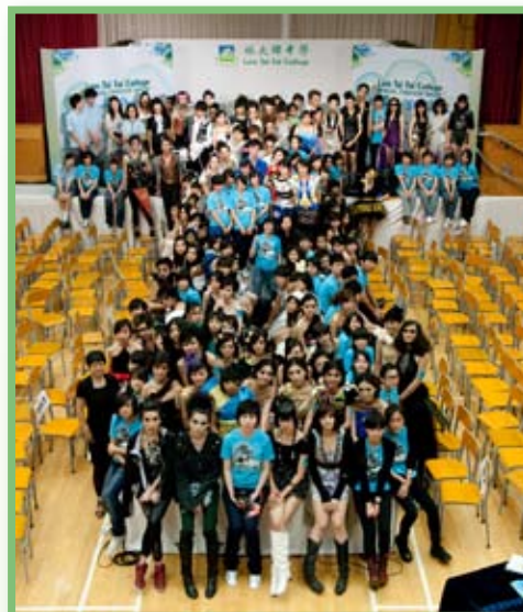
本年時裝匯演大合照