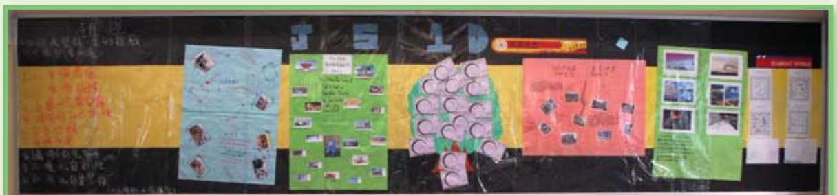
壁報設計比賽優異獎— 1D 班

在家長及學生的支持下，本校共籌得善款 $60,442.1 元。籌得款項已於 5 月 26 日悉數存入「香港紅十字會」青海地震賑災戶口作災區重建等援助之用，直接幫助災民！在此，再次感謝各位家長踴躍支持，慷慨解囊！