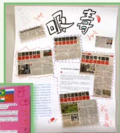
學生優良作品展板