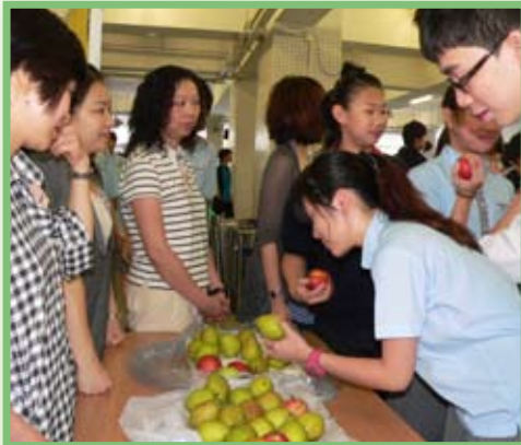
午間設有攤位派發水果

「家長義工服務組」計劃，先由校方組織熱心的家長暨負責老師透過家長義工服務試驗計劃組織家長義工服務組，在2009-2010年度試行校園生活服務，然後檢討優化，在下學年提交「家長義工服務種子計劃」。該組的服務內容包括：透過校園生活服務，例如參與學生午膳管理、支援學校特色活動、支援學校環境教育及戶外多元學習等生活教育，讓家校合作有更生活化的內容。為鼓勵更多家長加入「家長義工服務組」，將設立獎勵制度，分設時數及特殊貢獻兩項感謝狀，由家長義工服務組紀錄家長義工校園生活服務的時數及提名，以學年計算，由校方頒贈感謝狀。