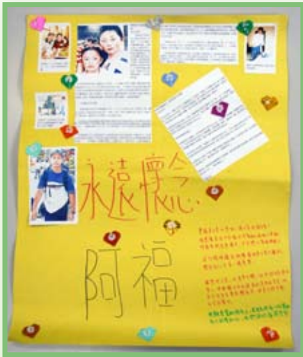
通識科時事作品—— 懷念黃福榮先生

同時，為培養同學建立正確的價值觀，學習表達及延續對國內貧困同胞的關愛，本校亦舉辦了「青海地震」教育及籌款活動系列，內容包括全校師生早會默哀、早會學生分享、填寫『心意咭』、『中國青海地震』——關懷祖國壁報設計比賽、通識科時事分析及回應、『中國青海地震籌款活動』、及『中國青海地震』壁報展等。