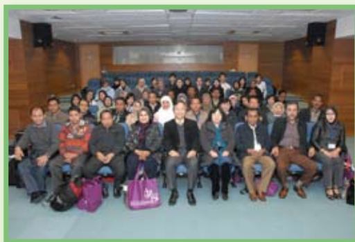
各位教授及碩士畢業生與本校校長及師生大合照。

於3月10日，由印度尼西亞「公共衛生系」4位教授及37位碩士畢業生(The Hasanuddin University Indonesia)所組成的交流團，親臨本校探訪，觀摩本校推行健康教育的現況及成果。首先由吳校長介紹學校辦學理念、相關的健康教育課程及活動，然後由8位本校高中一學生帶領參觀校園及講解本校推行的健康教育活動，互相分享兩地推行健康教育的現況及成果。