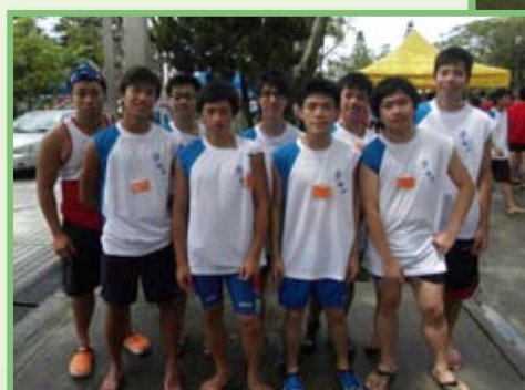
端午節龍舟比賽團體