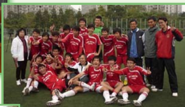
男子甲組足球隊比賽後奪冠團體大合照