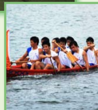
端午節龍舟比賽中