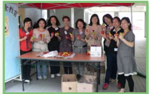
義工家長小組及老師大合照

在5月17至20日午膳時間，家長義工們配合學校健康教育科的健康飲食教育活動「生果週」作義工服務，除分別進入初中一、初中二及初中三教室簡介這次「健康飲食教育義工服務」的性質、健康飲食的意義（吃生果的意義），然後派發生果，包括香蕉、蘋果、香梨及雪梨等，又在地下操場及小賣部派發生果給其他同學。活動舉行期間，不但義工派得開心，同學吃得開心，家校合作的意義也充分表現出來了。