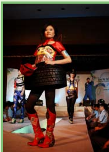
高中組冠軍主題：奔馳