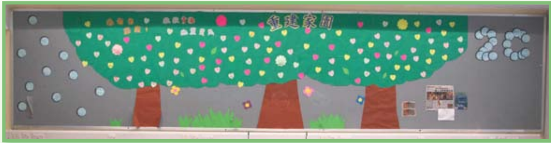
壁報設計比賽得獎者—2C班

本年 4 月 14 日於中國青海省玉樹縣發生黎克特制 7.1 級強烈地震，受災及鄰近地區受到嚴重影響，死傷嚴重，家破人亡，聞者傷心流淚。為表達我們對祖國的關懷，並對仍在水深火熱之中災民的關心，本校於 4 月底發動「青海地震」教育及籌款活動，呼籲全體家長及師生，獻出我們的愛心，踴躍捐款支持賑災支援工作，而籌得之善款將全數撥交「香港紅十字會」作緊急賑災之用。於 2010 年 4 月 30 日本校舉行捐款行動，讓同學學習施予，為急同胞之所急盡一分力。