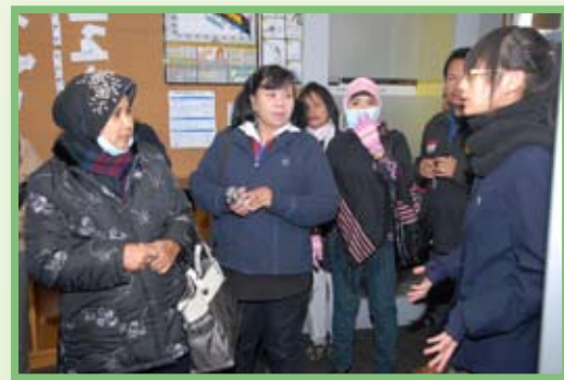
學生代表為嘉賓介紹本校健康教育科及活動的情況。