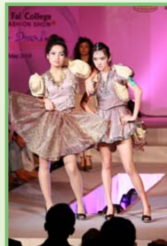
高中組亞軍主題：隅石