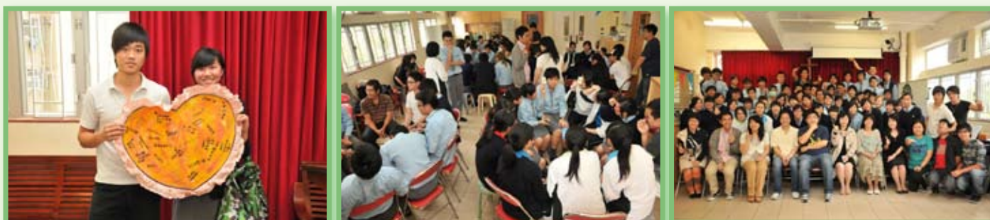
中六級探訪靈愛青年中心（中途宿舍）花絮