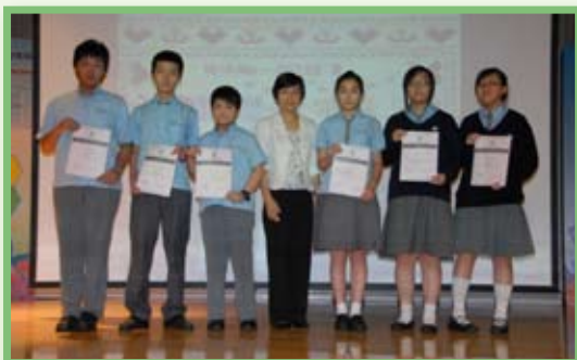
週會中頒發獎狀予表現出色的同學