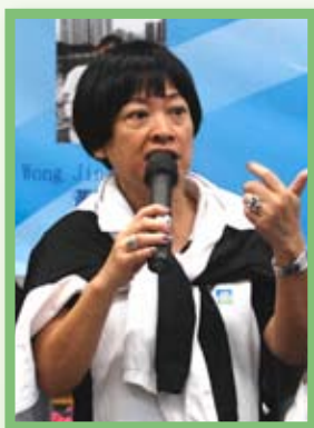
老師踴躍表達意見，討論來年學校發展重點。

在5月7日至8日，一連兩天於本校一樓英語活動室舉行教師研討會，全體老師按所負責的工作，分為三大組別，包括「學校行政」、「教與學」及「學生成長」，進行重點式分組討論及匯報，一起檢視及評估過去一年學校各重點發展的成效。期間，老師熱烈地表達意見，分享對學校發展的意見。