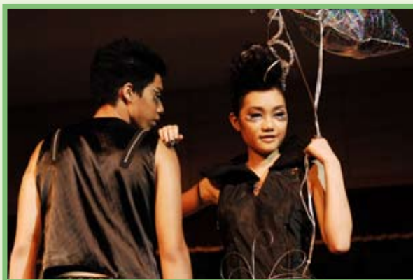
優秀作品主題：摘星奇緣