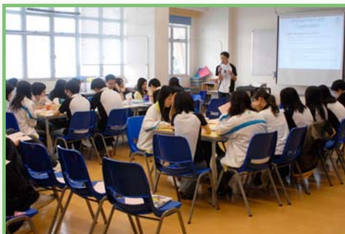
全校老師分成不同關注學校重點的小組，檢討成果及匯報各重點。

最後，在「學生成長」方面，主要關注重點是營造校園文化，例如建立歸屬感、推動學生自治自律、繼續優化家校合作及發展學生領導才能，藉以培養學生在情意及行為層面上的素質，建立正確的人生觀及處事態度，落實全人教育的理念。