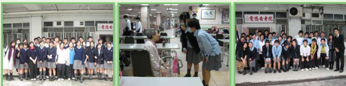
初中三義工服務花絮